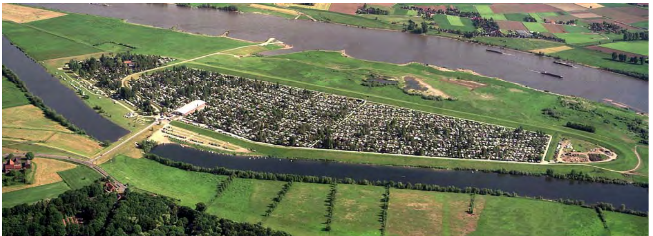
Erholungszentrum Grav-Insel Teilansicht. Der größte Familiencampingplatz in der Bundesrepublik, gleichzeitig Geburtsstätte der MAGMAS 50

Wollen Sie uns nicht einmal besuchen und die „MAGMA-Produktion“ besichtigen? Wenn Sie uns besuchen wollen, dann fahren Sie in Wesel bitte immer den grünen Schildern nach. Die „Grav-Insel“ ist im Stadtgebiet überall ausgeschildert. Wir freuen uns auf ihren Besuch! Herzlich Willkommen!