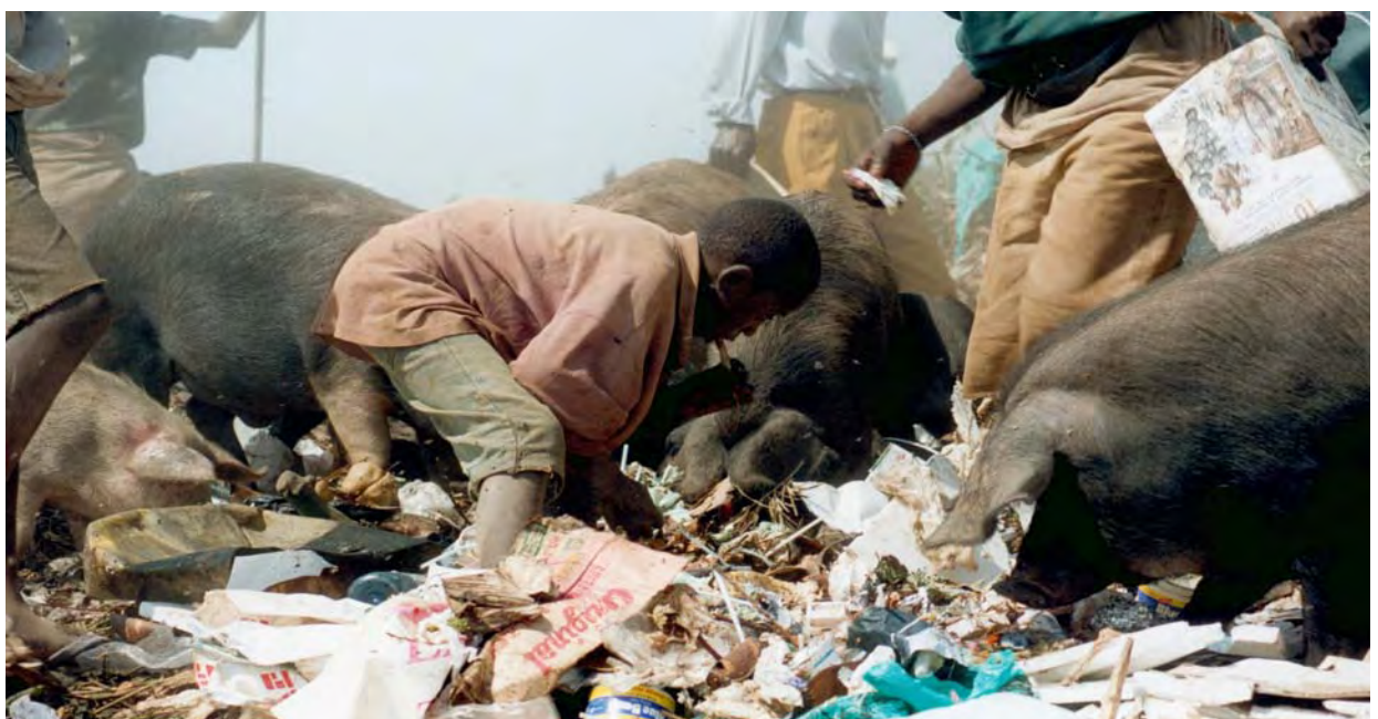
Leben auf einer von vielen afrikanischen Müllkippen